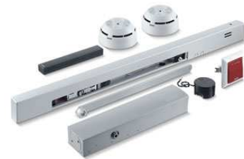
Die neue GEZE Funckerweiterung FA GC 170

Gebäude sicherer, komfortabler, effizienter und damit wirtschaftlicher betreiben: GEZE stellt neue innovative Systemkomponenten für Brandschutztüren vor. Ein weiteres Highlight ist das neue Gebäudeautomationssystem GEZE Cockpit als erstes smartes Tür-, Fenster- und Sicherheitssystem.